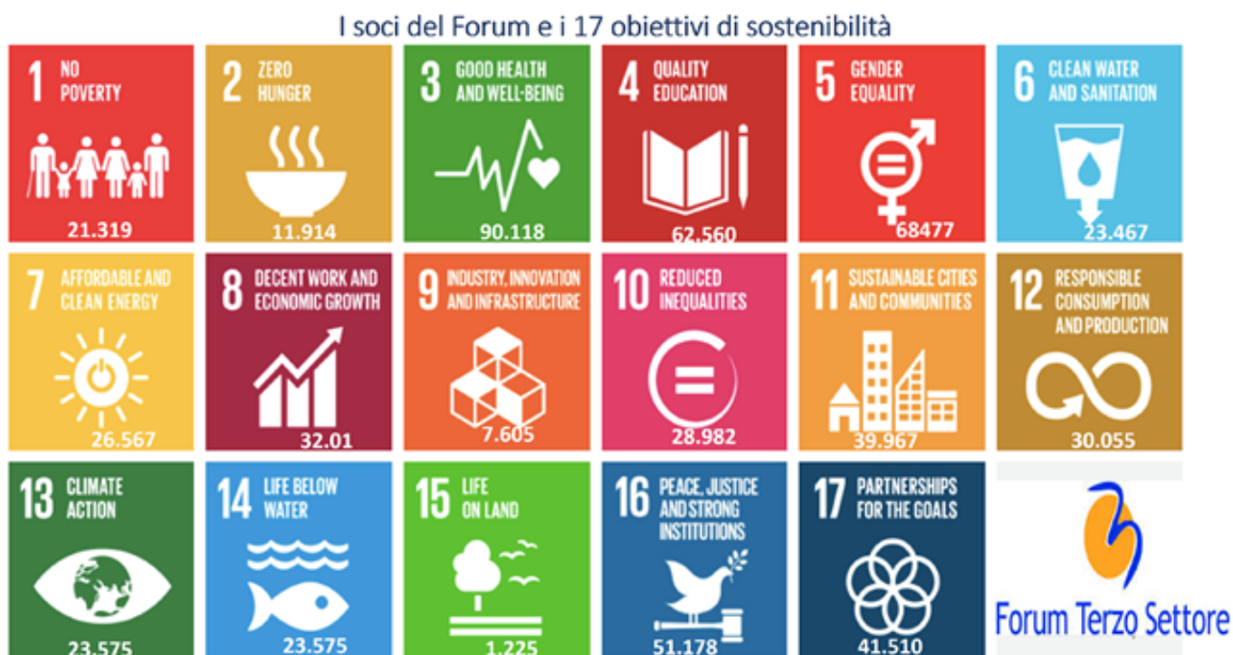
Tavola 3 - Numero di enti che risultano attivi per ogni SDGs (risposta multipla)