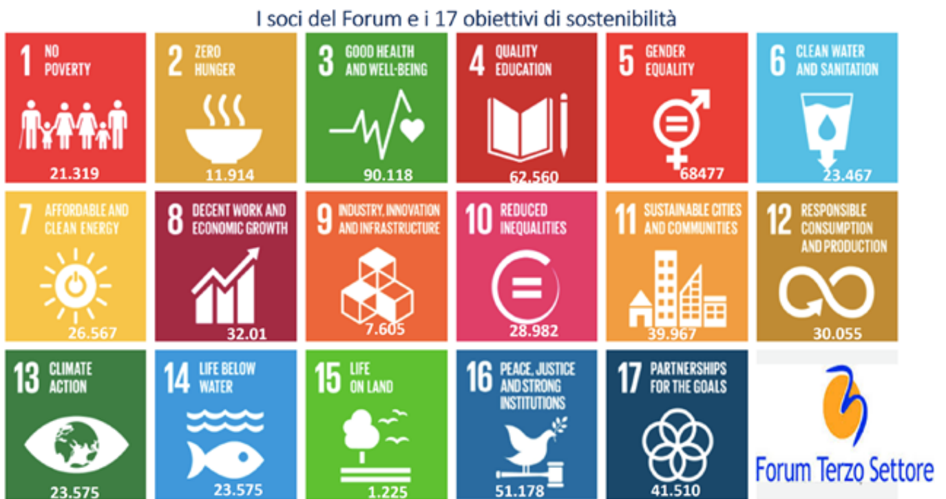
Tavola 3 - Numero di enti che risultano attivi per ogni SDGs (risposta multipla)