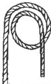
NODO PER ANCORAGGIO ALLE SOSTE si usa nelle manovre di ormeggio deve essere tenuto in una tensione costante per essere utile

non si distingue bene chi tiene o chi è tenuto (quale reciprocità possibile: modelli generativi)